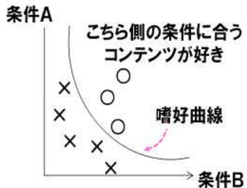
嗜好モデルのイメージ図

嗜好学習型のエンジンは、ユーザーの嗜好性の学習に時間を要したが、本エンジンは、独自の学習ロジックにより検索結果画面を2回程度見るだけで嗜好を推定でき、学習スピードの高速化に成功しました。